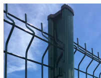
Poteau H alu 250