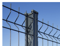
Poteau H à encoches