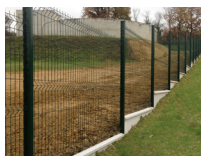
Montage en redan