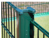
Poteau H alu 155**