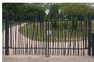
PORTAIL DOUBLE VANTAUX