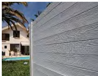
PLAQUE TYPE CLIN