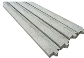
CHAPERON DE FINITION