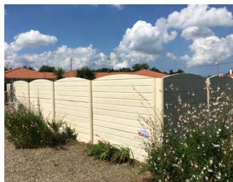
DEMI PLAQUE CHAPERON