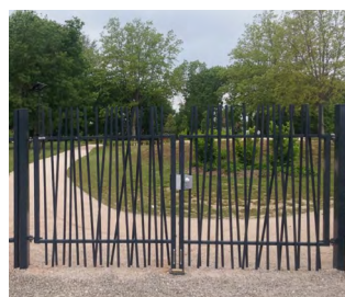
PORTAIL DOUBLE VANTAUX