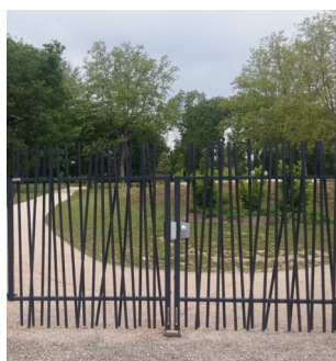
PORTAIL DOUBLE VANTAUX