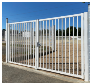
PORTAIL DOUBLE VANTAUX