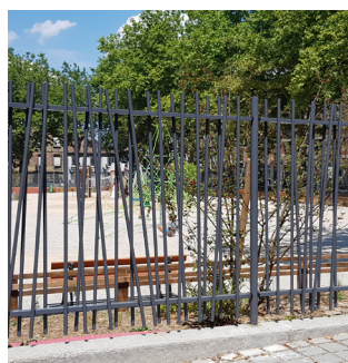
PORTAIL DOUBLE VANTAUX